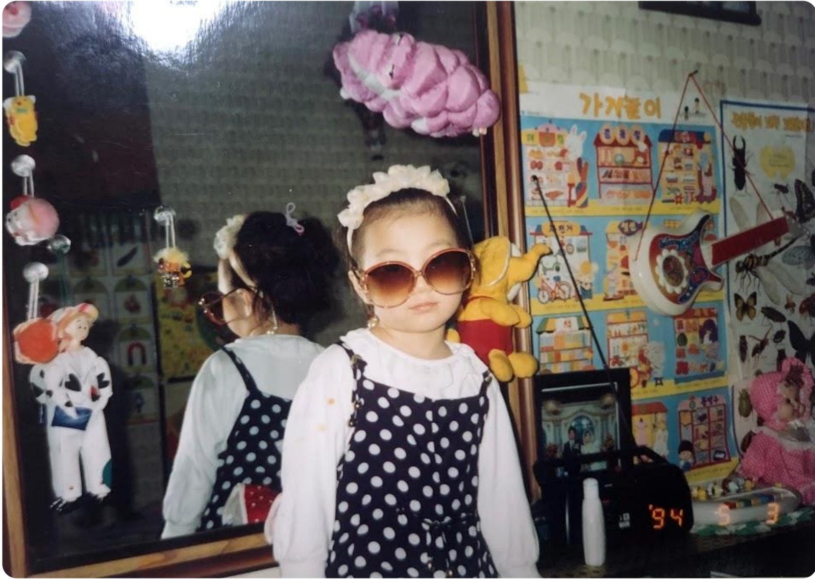
사진이 없을 경우, 내 모습을 그려도 좋아요!

내 사진을 한 장 골라, 네모 칸 안에 붙여주세요(두 장 붙여도 돼요).